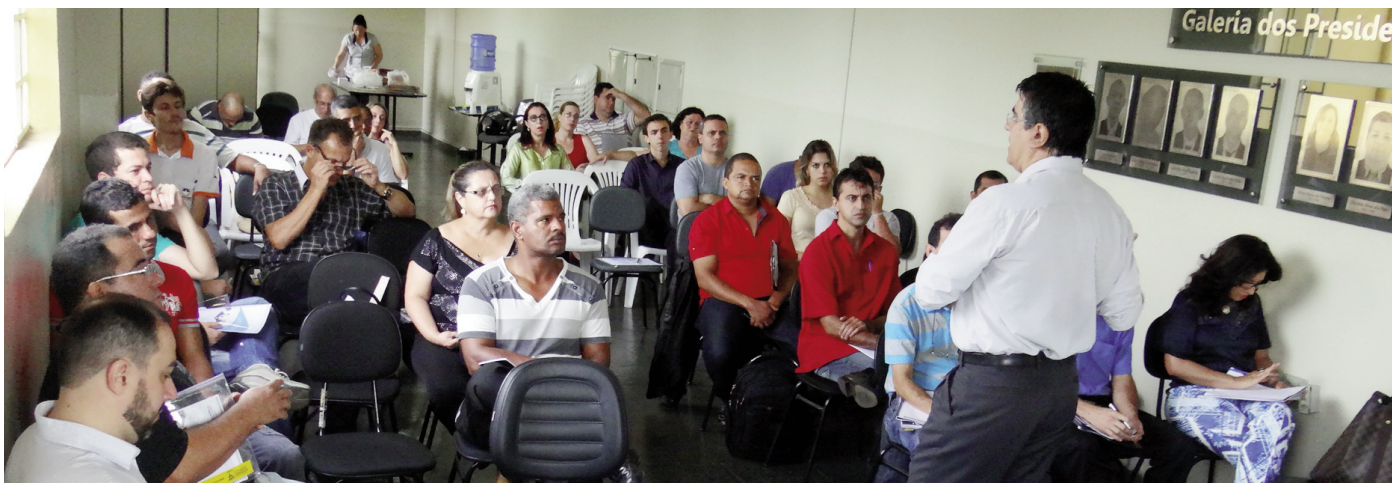
Curso foi ministrado na sede do Sindicato dos Trabalhadores Municipais de Divinópolis no final de abril para os conselheiros do Instituto da Previdência